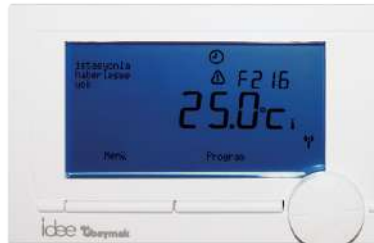
Baymak idee Programlanabilir Kablosuz (RF) Oda Termostatı (16900403)