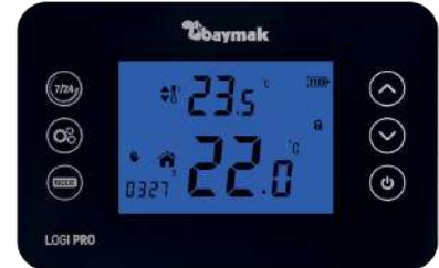
Baymak Logi Pro Kablosuz Programlanabilir Oda Termostatı (100022440)