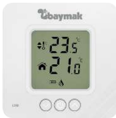
Logi Oda Termostatı (100021978)